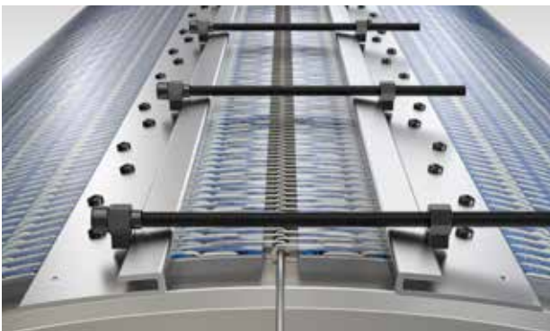
GKD Simple Clamping System (SCS)

el riesgo de deslizamiento entre el rodillo motriz y la banda corrugadora. La alta fuerza de pretensión evita la torsión del recubrimiento, haciendo innecesaria una fijación mecánica. Los recubrimientos no se aplican en fragmentos, sino en una sola pieza a todo el ancho del tambor.